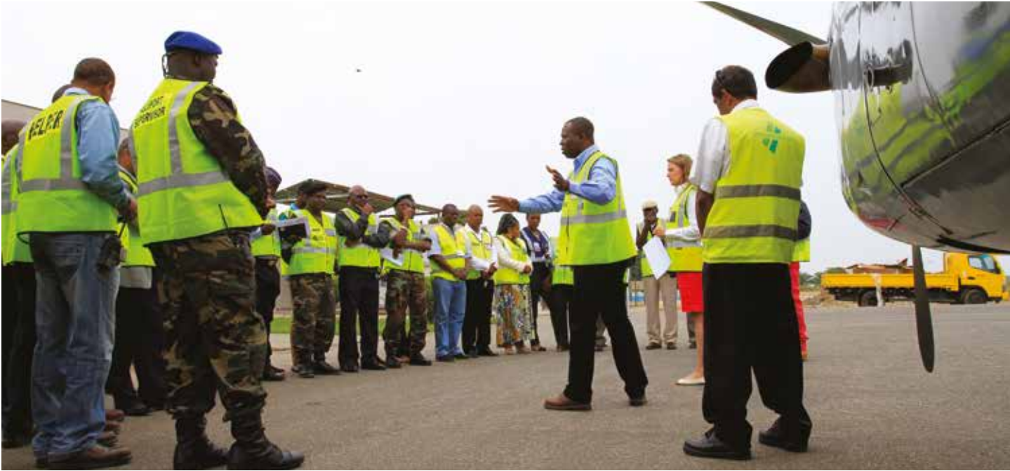
O avião de dispersantes(WACAF) a serviço da África Ocidental e Central a ser apresentado às autoridades em Cabinda